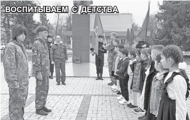
ВОСПИТЫВАЕМ С ДЕТСТВА